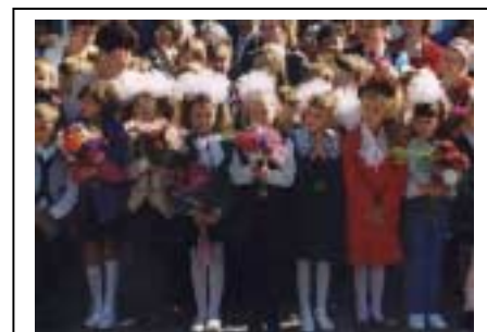
F Fyrsti dagur skólaársins. Í Esso þorpi íbúamir af mismunandi uppruna, einkum Eveny fólk og Rússar. Frumbyggjarnir eru um 30% íbúanna. Bystrinsky þjóðgarðurinn, Kamchatka, rússneska ríkjasambandið. Myndina tók Emma Wilson, 1999

Fyrir á tímum lærðu börnin alltaf störf hinna fullorðnu með því að fylgjast með föður sínum að veiðum eða móður sinni þegar hún var að verka skinn. Nú búa sum þeirra í bæjum og verða að læra takta og tilbrigði bæjarlífsins. En þeir sem búa á túndrunni og í skóginum standa nú andspænis vandamáli. Til að læra að komast einnig af í heimi nútímans verða þeir að fara í skóla.