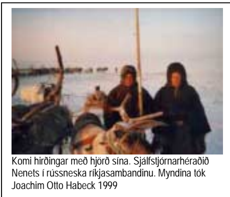
Komi hirðingar með hjörð sína. Sjálfstjórnarhéraðið Nenets í rússneska ríkjasambandinu.

árum, skömmu áður en Víkingar náðu þangað frá Evrópu. Víkingar fluttu með sér landbúnaðarmenningu. Þjóðfélag þeirra hélt velli í næstum 500 ár, en leið undir lok. Til þess liggja trúlega eftirfarandi, samþættar ástæður; loftslag breyttist til hins verra, fæðuöflun brást og þeir náðu ekki að viðhalda tengslum við Evrópu. veiðimenn heimskautasvæðanna löguðu sig hins vegar að kaldara loftslagi og urðu forfeður nútíma Grænlandinga. Í norðanverðri Asíu, svo annað dæmi sé tekið, er stærsti þjóðflokkurinn Sakhar alls um 382,000. Þeir tala tungumál sem er skylt tyrknesku og fluttu sig ekki um set frá mið-Asíu inn í Lena dalinn fyrr en á miðöldum. Þegar þangað kom, var Eveny þjóðflokkurinn fyrir í dalnum, en þeir hröktu þá á brott upp í fjöllin þar sem þeir eru nú hreindýrahirðar. En jafnvel Eveny fólkið átti ekki upprunalega aðsetur á heimskautaslóðum, heldur var aðflutt frá norður Kína og er skylt Manchu þjóðflokknum sem stýrði kínverska keisaradæminu allt fram í byrjun tuttugustu aldar.