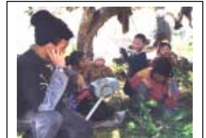
Eveny Hreindýrahirðar reyna að nú radiosambandi við þorpið. Þetta er eina leið þeirra til að ná sambandi við umheiminn ef upp kemur neyðarástand. Bystrinsky þjóðgarðurinn, Kamchatka, rússneska ríkjasambandið. Myndina tók Emma Wilson, 1998,

Í skjóli þessara sameiginlegu lífshátta hafa svo mismunandi hópar fundið sérleiðir til að aðlagast eigin umhverfi. Inúítar og ættingjar þeirra, eins og t.d. Yuit og Inupiat í Alaska sem og Kalaalit (Grænlandingar) á Grænlandi, byggja megnið af strandlengju heimskautsins. Á þessum svæðum er landið ófrjótt og þeir lifa á því sem sjórinn gefur, fiskveiðum og sel- og hvalveiðum. Þessi lífsmáti verður til þess að sjórinn tengir saman eyjarnar í stað þess að aðskilja þær. Á sumrin ferðast Inúítar í húðkeipum (kajökum) og bátum af öðrum gerðum, en skjótasti ferðamátinn yfir sjávarísinn að vetrarlagi er hundasleðinn eða vélknúni snjósléðinn.