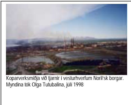
Kopparverksmiðja við tjarnir í vesturhverfum Noril'sk borgar. Myndina tók Olga Tutubalina, júlí 1998

Aðkomumennirnir geta ekki tileinkað sér daglegt fæði sem alfarið byggist á því kjötmeti sem landið gefur af sér. Því þurfa þeir að verða sér úti um miklar birgðir matvæla og annars sem til þæginda má verða annars staðar frá til að halda heilsu sinni og hamingju.