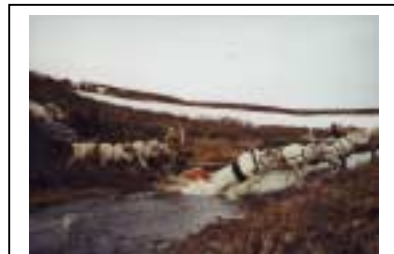
Hreindýrahirðar á leið yfir Yarei-Shor fljót í Nenets sjálfstjórnarhéraði, rússneska ríkjasambandinu. Nú er hlákan í algleymingi og mikil hætta stafar af stríðum straumi fljótsins. Ein sleðalestin af annarri kemst yfir hindrunina. Myndina tók Joachim Otto Habeck, júní 1999

Samkvæmt báðum þessum skilgreiningum myndu mörk heimskautasvæðanna liggja sunnar en hinn svonefndi heimskautsbaugur, en hann er ímynduð lína sem dregin er á kort á breiddargráðunni 66° 33' norður. Hér sígur miðnætursólin niður að sjóndeildarhringnum eina nótt, en hverfur ekki niður fyrir hann. Þetta er hin fræga miðnætursól. Þegar farið er lengra norður í átt að norðarpólnum, verða sumarnæturnar æ