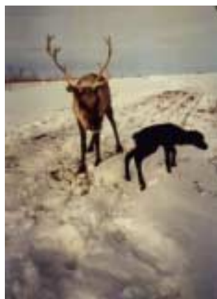
Kýr með kálf. Hún fæddi rétt áður en myndin var tekin. Í grennd við fljótið Kolva-Vis, í Nenets sjálfstjórnarhéraði, rússneska ríkjasambandinu. Myndina tók Joachim Otto Habeck, maí 1999

Hann verður að hugsa eins og selurinn og reyna að ímynda sér hvar hann muni koma upp. Ein vanhugsuð hreyfing og selurinn er á bak og burt. En hafið býr líka yfir hættem og margir veiðimenn drukkna þegar sviptivindar hvólfa kajökum þeirra.