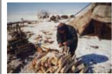
Fyrir fram tjald hirðingja. Nenets sjálfstjórnarsvæðið, rússneska ríkjasambandið. Myndina tók Joachim Otto Habeck, 1999

Í norðurhéruðum Rússlands eru þrjár þjóðflokkar, með nokkur hundruð þúsund íbúa hver, Komi, Karelian og Sakha. Hver um sig á sitt eigið sjálfstjórnarsvæði, enda þótt þar séu yfirleitt fleiri Rússar og aðrir evrópskir landnemar, þar á meðal Úkraínunmenn. Síðan er um að ræða 26 minni hópa sem tilheyra nokkrum tungumálaflokkum og dreifast yfir alla Síberíu. Þessi þjóðarbrot telja frá nokkrum hundruðum upp í fáein þúsund hver, og