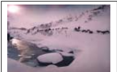
Skógi vaxin Kyrnys-dy eyja í grennd við fjötið Kolva-Vis, í Nenets sjálfstjórnarhérad. Lest sleða og hreindýra þokast hægt móti köldum vindinum sem ennheldur túndrunni í frosnum greipum sínum. Hreindýrin eru nýkomin framhjá einni af síðustu skógareyjum á leið sinni gegnum túndruna. Myndina tók Joachim Otto Hahark maí 1000

Það er síðla vetrar og frostið er 40 gráður á Celsíus. Sjórinn er frosinn allt að tvo km. út frá ströndinni. Langt úti á ísum er veiðimaður einn síns liðs að mjaka sér á átt að sel sem hefur komið upp í gegnum gat á ísum til að anda og liggur nú á ísbreiðunni. Veiðimaðurinn, sem ýtir á undan sér riffli, leynist undir hvítri segldúkspjöttlu. Ekki sjást þess merki að neinn sé undir segldúknum, að undanskildu smáskýi sem þéttist yfir honum og stafar af andardrætti hans. Ef hann er heppinn og kann til verka mun selurinn ekki veita honum athygli fyrr en það er um seinan.