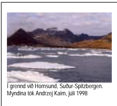
Í grennd við Hornsund, Suður-Spitzbergen. Myndina tók Andrzej Kaim, júlí 1998

Veiðimaðurinn á ísum tilheyrir þjóðflokki er nefnist Inúítar, á þeirra máli merkir orðið einfaldlega “fólk”. Inúítar eru þjóðflokkur sem utanaðkomandi fólk kallar ennþá Eskimóa, en þeir eru flestir lítt hrifnir af þeirri nafngift. Samfélög sem nefnast öðrum nöfnum, en eru skyld Inúítum, búa á ströndum Grænlands og Alaska og einnig í Síberíu í Rússlandi. Hreindýrahirðarnir tilheyra Eveny fólkinu, mjög frábrugðnum þjóð sem býr í fjöllum Norðaustur-Síberíu. Inúítar og Eveny are aðeins tveir af mörgum tugum þjóða frumbyggja á heimskautasvæðunum sem hafa búið þar svo lengi að þeir líta á þessi svæði sem sitt land. Þótt margir búi í þéttbýli, tileinka þeir sér enn lifnaðarhætti sem byggjast að verulegu leyti á sel- og hvalveiðum eða hjarðmennsku með hreindýr.