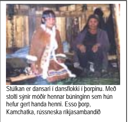
Stúlkan er dansari í dansflokki í þorpinu. Með stolti sýnir móðir hennar búninginn sem hún hefur gert handa henni. Ezzo þorp, Kamchatka, rússneska ríkjasambandið

Þótt margt sé ólíkt með því fólki sem byggir norðlægur slóðir, hefur það fundið svipaðar leiðir til að nýta þau efni sem fyrir hendi eru sér til viðurværis. Þetta á ekki bara við um veiðitækni. Á öllum þessum svæðum eru dýraskinn eina efnið sem er nógu þjáltilt að gera úr því fatnað og skó, svo og tjöld og bátaskýli.