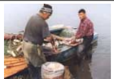
Fiskveiðar á Kamchatka fljóti í rússneska ríkjasambandinu. Samtök frumbyggja í Bystrinsky héraði veiða fisk sem miðla skal til fátækra og aldraðra á svæðinu. Myndina tók Emma Wilson, 1998

Dýrin leggja líka til megnið af fatnaði og efnivið til áhaldagerðar og húsa.