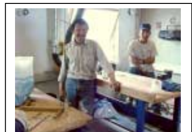
Tasillaq, Austur Grænland. Á verkstæði þar sem gerðar eru höggmyndir með hefðbundnu sniði. Myndina tók Andrzej Perzanovski, 2000

Sumt í þessum átrúnaði hefur veikst á okkar öld vegna áhrifa frá kristniþóðum, kennurum og embættismönnum. Lengi vel sneru frumbyggjarnir sjálfir baki við trú af þessum toga til að svo liti út sem þeir væru “nú tímalegir”. Samt lifa þær enn góðu lífi margar hugmyndirnar um samband manna og dýra. Sumir Inúítar á Grænlandi hvísla enn “þakka þér fyrir” að nýveidda selnum. Það er nú svo komið að margir af yngri kynslóð frumbyggja, sem horfa upp á skelfingar þær sem iðnaðarþjóðfélagið leiðir yfir náttúruna, hafa hallast að hugmyndum foreldra sinna og forfeðra og sjá þær nú gjarna í nýju og betra ljósi.