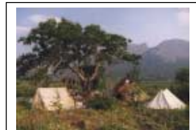
Tjaldbúðir hreindýrahirða að sumarlagi. Nú á dögum eru tjöldin gerð úr segldúk og hreindýraskinn eru notuð sem gólfmottur. Bystrinsky þjóðgarðurinn, Kamchatka, rússneska ríkjasambandið. Myndina tók Emma Wilson, 1998

Sérstakur og óvenjulegur þjóðflokkur, Samar, býr í Norður Noregi, Svíþjóð, Finnlandi og Rússlandi. Þeir eru um 35,000 talsins og hafa sennilega búið á þessum slóðum í 4,000 ár. Samarnir á ströndinni stunduðu veiðar á sjávarfiski, en þeir sem bjuggu inni í landi voru hreindýrahirðar eða veiddu ferskvatnsfisk. Samar eiga sér langa sögu nánna samskipta við hina skandinavísku íbúa og nú stunda aðeins 10% þeirra hreindýraeldi.