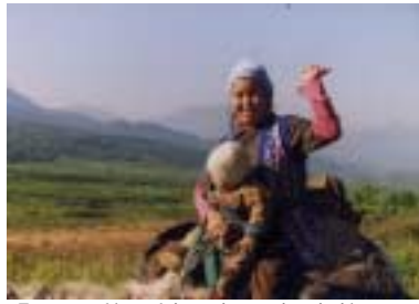
: Eveny móðir með kornabarn á hestbaki. Bystrinsky þjóðgarðurinn, Kamchatka, rússneska ríkjasambandið.

En oft eru skólarnir í þorpum og bæjum langt frá heimilum foreldranna, svo að börnin verða lengst af að búa fjarri foreldrum sínum í heimavistarskólum. Þar læra þau fræði sem eru í litlum tengslum við lífið heima fyrir og þau fjarlægjast heim foreldranna. Þeim er líka oft kennt á ensku, rússnesku eða dönsku svo að þau glata hæfileikanum til að tala sitt eigið tungumál. Meðal Eveny fólksins, til dæmis, fara börnin einungis úr þorpinu að sumarlagi til að sinna hreindýrahjörðunum og læra því aldrei að meðhöndla hreindýr yfir veturinn.