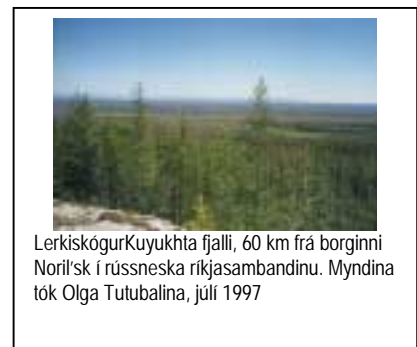
LerkiskógurKuyukhta fjalli, 60 km frá borginni Noril'sk í rússneska ríkjasambandinu. júlí 1997

Landið milli stranda íshafsins og skógarmarkanna er kallað tundra. Hér gnauða tíðum hvassir hafvindar og því er allur gróður lágvaxinn; grös, mosar, skófir og dverggrunnar. Inúítarnir sem lýst var í upphafi þessa kafla búa á nyrstu mörkum tundra, á sjálfri Íshafsströndinni. Sunnan trjálínunnar vex skógur sem í Síberíu nefnist taigá . Trén eru að mestu sígræn barrtré, en einnig er um lauftré að ræða, birki og víði. Hér, lengra inni í landi, er vindurinn ekki eins hvass, en meginlandsloftslaginu fylgja gjarna mun meiri vetrarkuldar en á tundra. Mesta frost á norðurhveli, um 70 stig á Celsíus hefur verið skráð í Verkhoyansk og Oymyakon í Norðaustur Síberíu, sitt hvorum megin við heimskautsbauginn. Á þessum slóðum býr Eveny fólk sem lýst var hér að ofan.