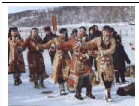
Eveny dansflokkur leikur listir sínar í upphafi litlu Beringja sleðakeppninnar. Avangai, Kamchatka, rússneska ríkjasambandið.

Fjöldmargir aðrir þjóðflokkar búa að mestu sunnan skógarmarka og stunda veiðar á fiski og landdýrum. Að auki eru flestir hópar í Evrópu og Asíu með hreindýrahjarðir. Á meðal þessara þjóðflokka sem búa inni í landi eru svonefndir Indíanar í Norður Ameríku og ýmis þjóðabrot í Síberíu.