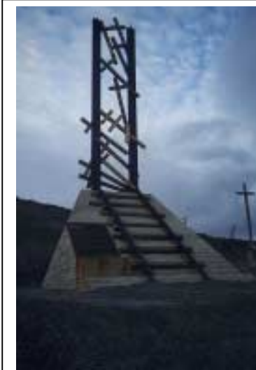
Minnismerki um pólska pólitíska fanga sem tóku þátt í gerð Dudinka-Noril'sk járnbrautarinnar. Gamli borgarhlutinn í Noril'sk, rússneska ríkjasambandið. Myndina tók Olga Tutuhalina árið 1997

Það var útbenslustefna Evrópumanna sem lokkaði þá til heimskautalandanna eins og svo margra annarra svæða á jörðinni. Á 16. og 17. öld, þegar landvinningar þeirra stóðu sem hæst, urðu Austurlönd fjær mikilvæg uppspretta gimsteina, kryddvöru og hágæða vefnaðarvöru. Þessi viðskipti gátu skilað gífurlegum hagnaði og þegar hefðbundnar