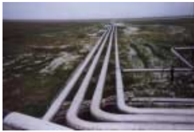
Gasleiðslur á Yamburg gasvinnslusvæðinu. Leiðslurnar flytja gas frá borholunum í vinnslustöðvarnar. Tazovskiy skaginn, Yamalo-Nenetskiy AO, rússneska ríkjasambandið. Myndina tók Benjamin Seligman, ágúst 1998