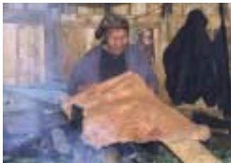
Gömul Eveny kona vinnur úr hreindýrskinni. Hreindýraskinn eru notuð til fatagerðar og til að búa til stígvél sem einkum eru notuð meðal dansflokka á svæðinu. Einnig eru búnar til töscur og minjagripir úr skinnunum. Eso þorp, við Kamchatka fljót, rússneska ríkjasambandinu. Myndina tók Emma Wilson, 1998

Veiðar, hjarðmennska og daglegt amstur í þessu óbliða umhverfi, gerir harðar kröfur til karla, kvenna og barna. Margir þjást af berklum og öðrum lungnasjúkdómum. Þetta er líka vettvangur oveiflegra hörmunga og margir deyja af slysförum. Menn geta orðið úti í stórhrið á berangri; Sumir hverfa niður um vakir á sleðaferðum yfir ísilögð vötn; jafnvel snjall veiðimaður nær kannske engri bráð dögum saman og sveltur ásamt fjölskyldu sinni. Það er ekki að undra þótt öll tilbrigði menningar á norðlægum slóðum meti mikils nákvæma þekkingu á staðháttum, svo og samhljál og aðstoð við fæðuöflun – slíkt er einkennandi fyrir veiðimannasamfélög um víða veröld.