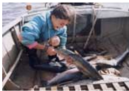
Ung stúlka af Nivkh þjóðflokki með nyveiddan lax. Lax er ríkur þáttur í daglegu fæði heimamanna. Nyivo flói, norðaustur Sakhalin, rússneska ríkjasambandið. Myndina tók Emma Wilson, 1998

Allir þjóðflokkar hafa þróað einhvers konar skíði, sleða eða snjóþrúgur. Margir hafa tamið hunda eða hreindýr til að flytja farangur eða draga sleða.