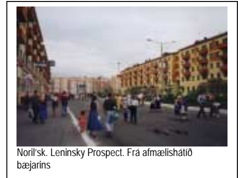
Noril'sk. Leninsky Prospekt. Frá afmælishátíð bæjarins

Tilgangur þeirra er að færa sér í nyt þeir auðlindir sem finnast á svæðinu og flytja þær suður á bóginn. Stór hluti aðfluttra dvelja aðeins um stundarsakir í bæjunum og flytja síðan aftur suður, kannske mun efnaðri. Í Sovétríkjunum gat hvítur maður tvöfaldað eða þrefaldað laun sín með því að starfa á norðursvæðunum. Hann átti svo forgang að húsnæði sem mikill skortur var á, þegar heim kom til Moskvu eða annarra borga í vesturhluta Sovétríkjanna.